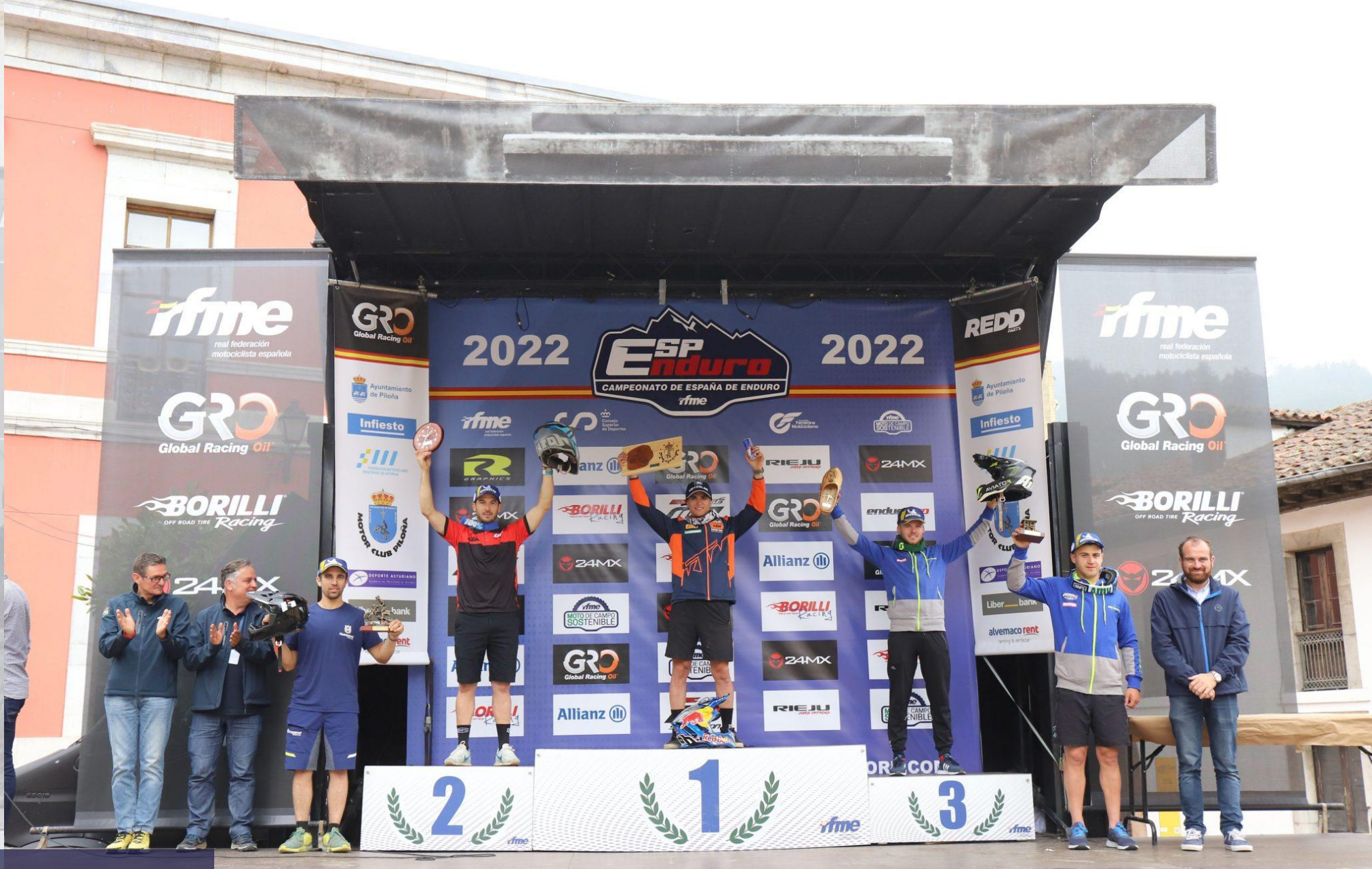
LOGOS EN PODIO