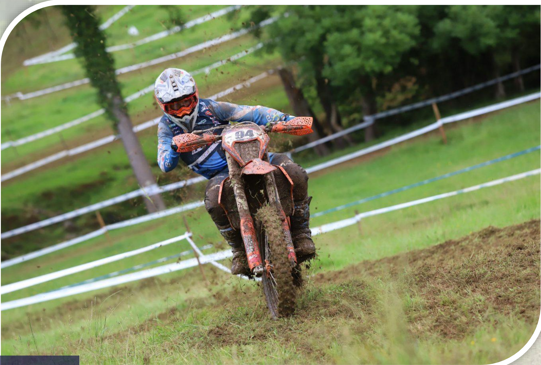
CINTA DE MARCAJE